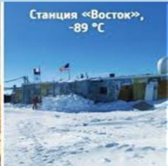
Станция «Восток», -89 °C