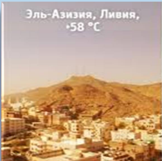
Эль-Азизия, Ливия, +58 °C

Долина Смерти в Калифорнии и место в Ливии, называемое Эль Азизия, удерживают рекорды самых горячих мест на Земле. Рекорд Эль Азизии — +57,8 градусов по Цельсию (13 сентября 1922 года), рекорд Долины Смерти — +55,8 градусов по Цельсию (10 июля 1913 года). А самым холодным местом на Земле признана Антарктика — 21 июля 1983 года на исследовательской станции «Восток» в Антарктике было зарегистрировано -89 градусов по Цельсию.